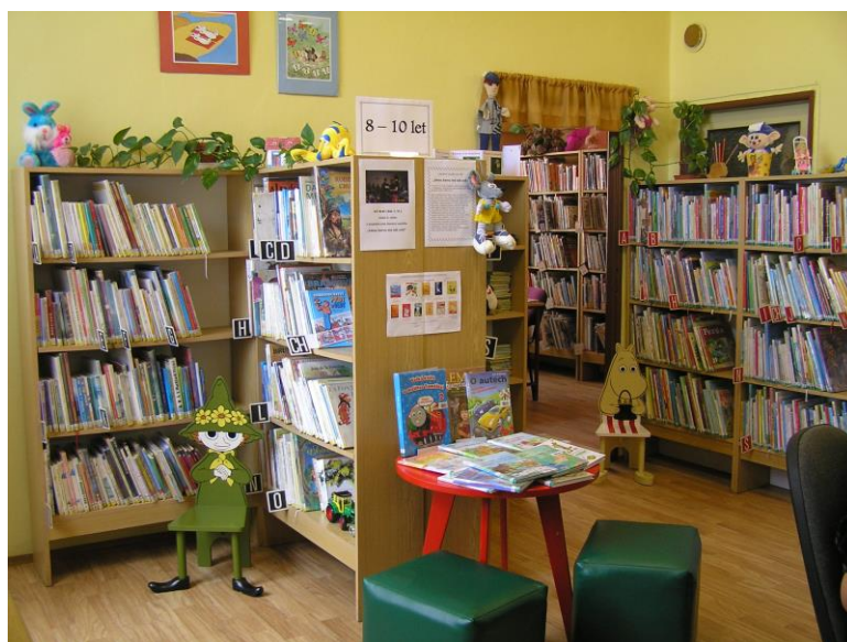
Dětské oddělení knihovny

Hospodářský výsledek organizace byl ve výši 0 Kč