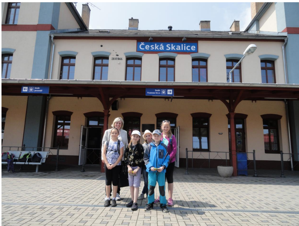
Zástupci naší knihovny na setkání dětských čtenářů v České Skalici

Adresa: Městská knihovna Rtyně v Podkrkonoší nám. Horníků 440 542 33 Rtyně v Podkrkonoší tel. 499 888 562, 772 720 881 e-mail: info@mkrtyne.cz www.mkrtyne.cz https://www.facebook.com/mkrtyne/